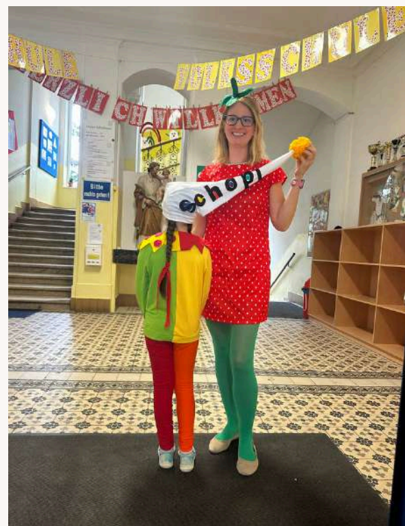
Unser Maskottchen Schopi - tolle Kostümidee!