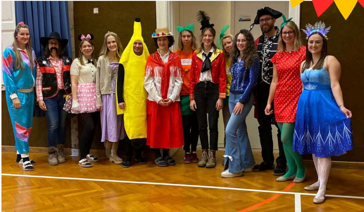
FASCHINGSPARTY 17.2.26 - LehrerInnenteam